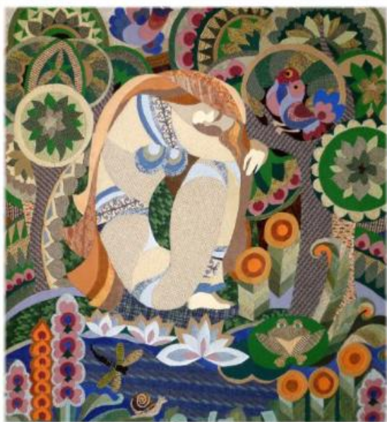
А если вздумает, что, конечно, случается, То скажет: соринка глаза запоршигла, И снова как солнышко всем улыбается, Простая, веселая очень хорошая.