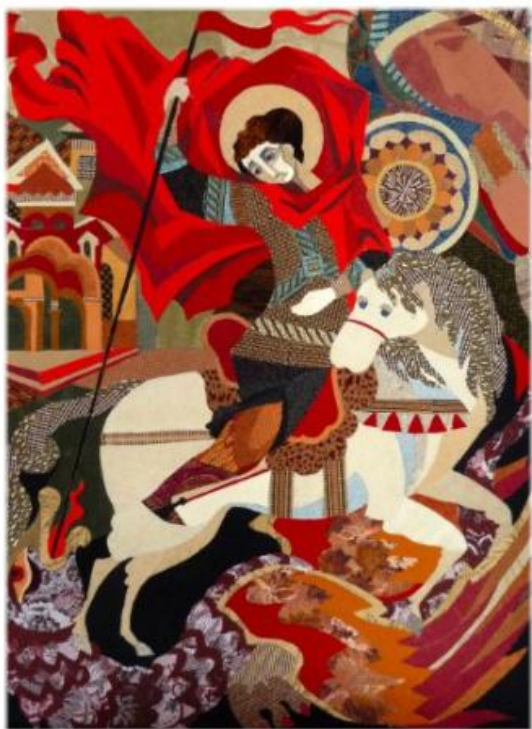
Вас Георгий водит святой — Крылатый и лугорный воевод... Н. Буланко