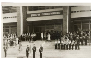
Открытие Дворца творчества (сентябрь 1984 г.)

Сдали долгожданный объект в эксплуатацию 27 августа 1984 года, а 1 сентября у всех горожан был праздник – Дворец открылся, гостеприимно распахнул свои двери. Простором и величием он поразил всех. Сразу же с чьей-то лёгкой руки за ним прочно закрепилось название «Дворец». Ни в одном из городов Ленинградской области нет такого пионерского Дворца. Торжественное открытие было назначено на День знаний - 1 сентября 1984 г. [2].