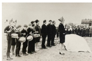
Открытие камня на месте строительства будущего Дворца (май 1972 г.)