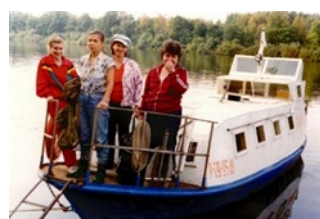
Работники станции натуралистов