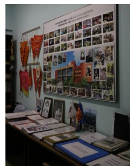
Выставка к 40-летию Дворца творчества

Начиная с 1965 года, Дом пионеров и школьников, Дворец пионеров, а теперь МАУДО «Киришский Дворец детского (юношеского) творчества имени Л.Н. Маклаковой» прошел большой, красивый творческий путь. За эти годы наши педагоги вырастили много талантливых детей: певцов, музыкантов, танцоров и спортсменов, художников, изобретателей, экологов, которые, став взрослыми, приводят к нам своих детей.