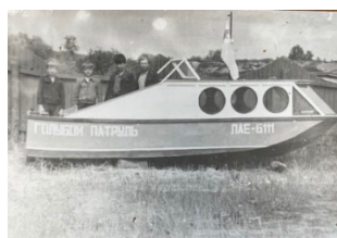
Катер станции натуралистов