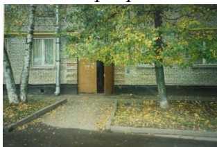
Помещение первого Дома пионеров

- Добрый день, дорогие ребята! Верите ли вы, что двухкомнатные квартира могла превратиться в прекрасный четырехэтажный Дворец? (показ фотографий)