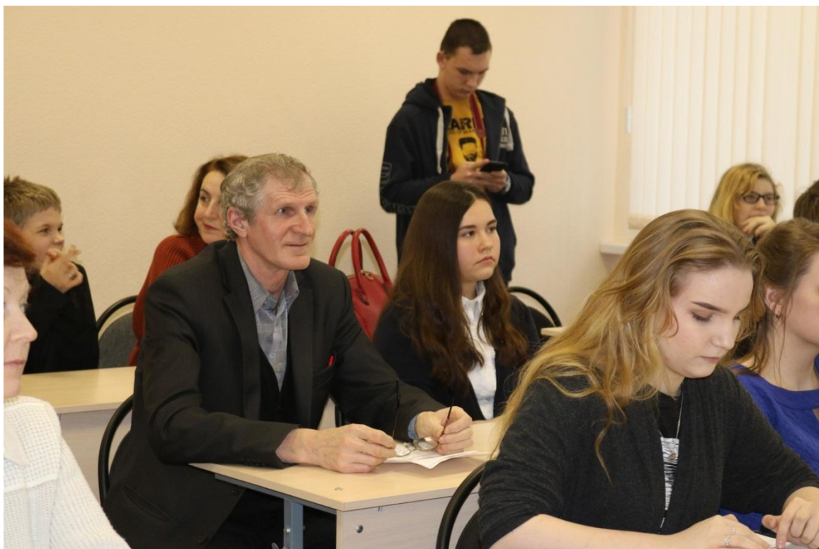
Работа секции «Удивительные растения и животные», старшая возрастная группа.