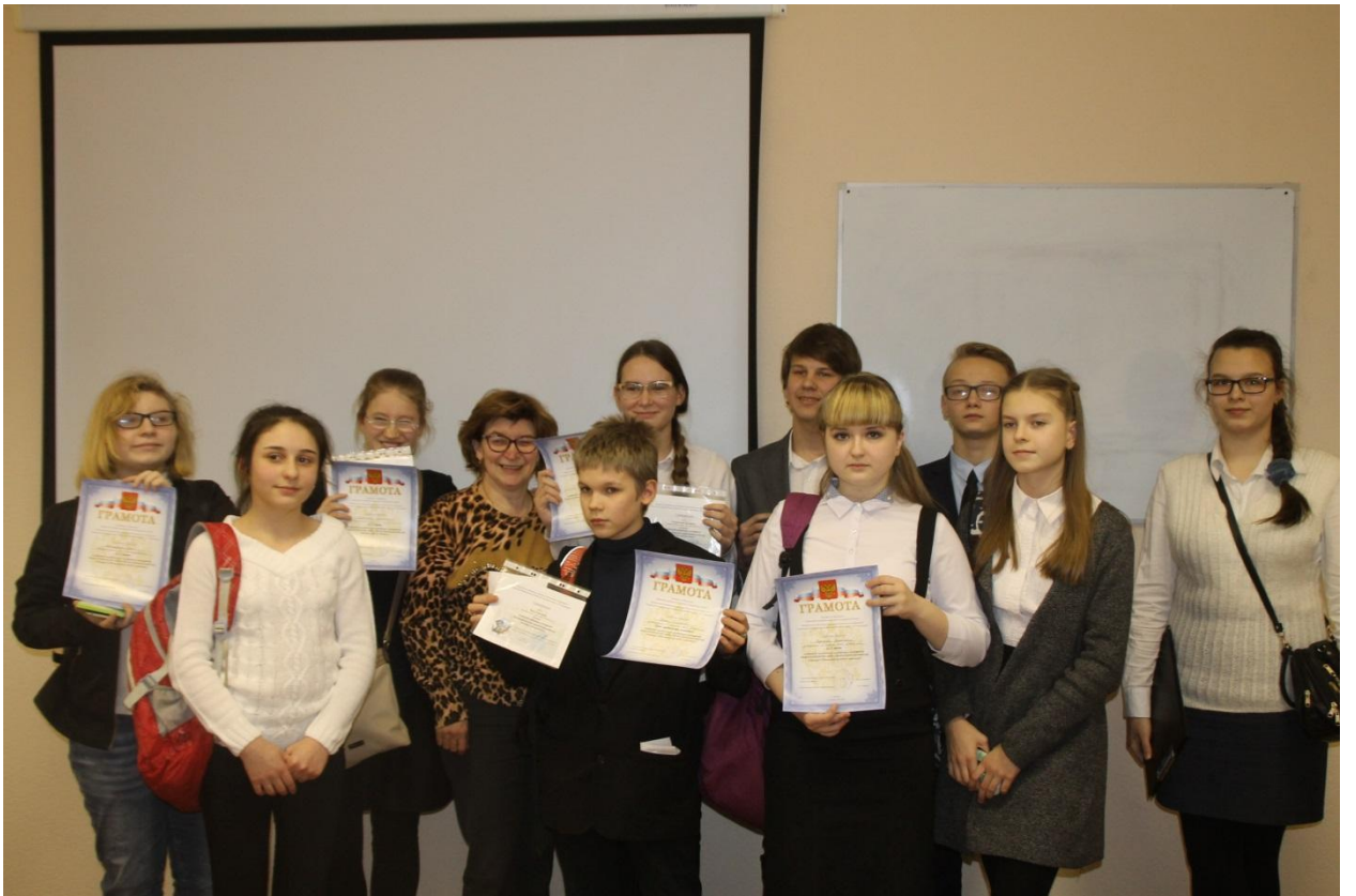
Фото на память: участники старшей возрастной группы со своими наградами.